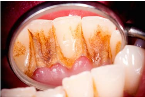
vor der PZR