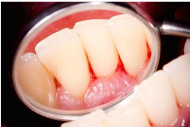
nach der PZR